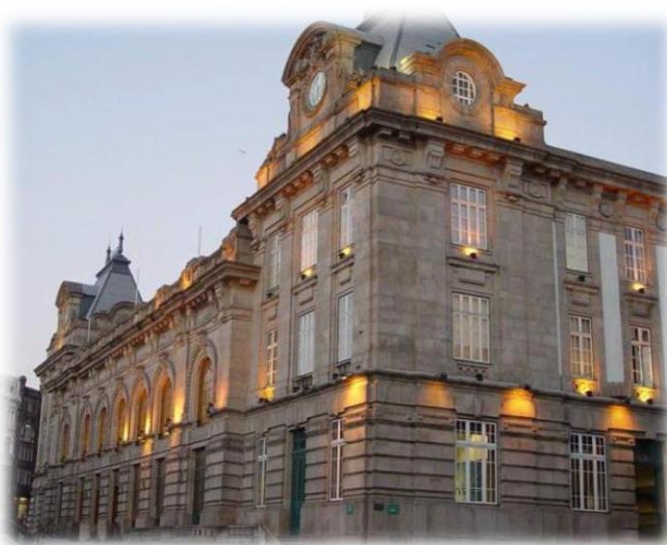
(Estação de São Bento)