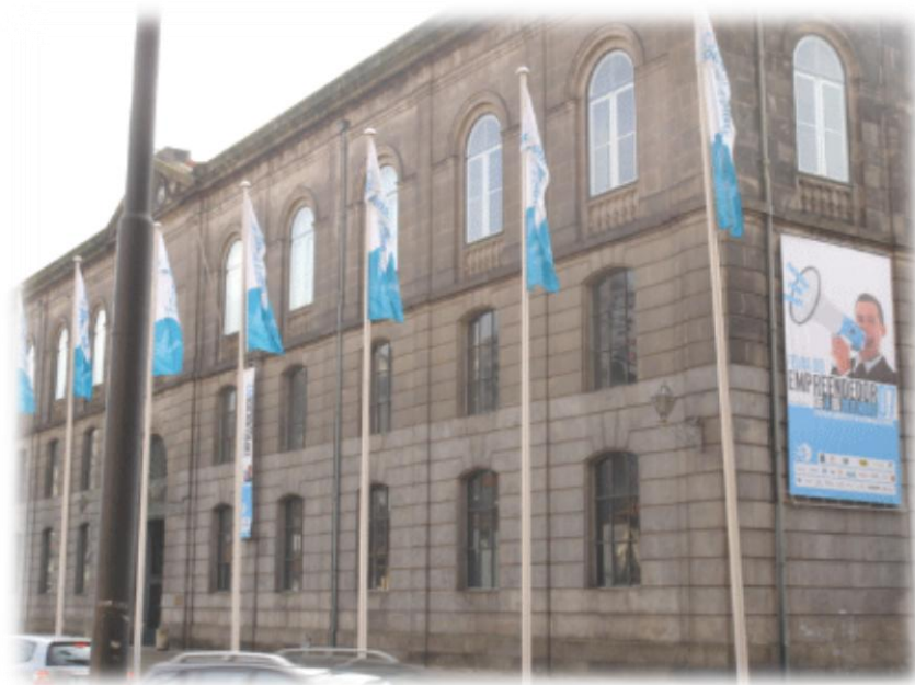
(Centro de Congressos e Exposições da Alfândega)