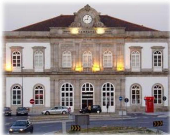
(Estação de Campanhã)